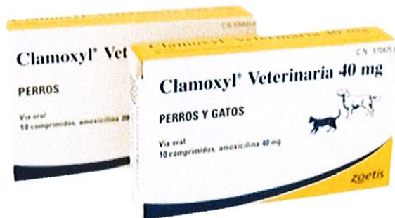
Clamoxyl para perros y gatos. Amoxicilina (antibiótico).

Esto supone un perjuicio para las farmacias ya que es precisamente con este tipo de artículos con los que puede garantizar una rentabilidad que les permita mantener sus puertas abiertas en un momento en el que la capacidad de pago de las Administraciones Públicas brilla por su ausencia, especialmente en algunas comunidades autónomas.