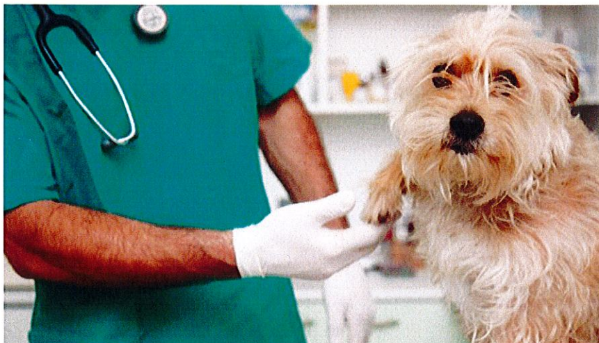
Un veterinario atiende a un perro.